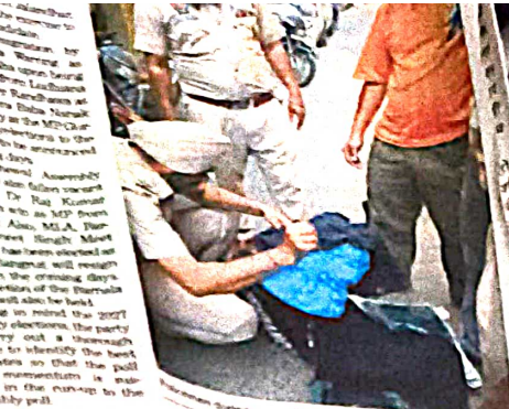
2,841 frisked at rly Stations, bus stands