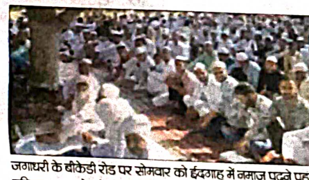
जगाधरी के बीकेडी रोड पर सोमवार को ईदगाह में नमाज पढ़ते पहुंचे मुस्लिम समाज के लोग।